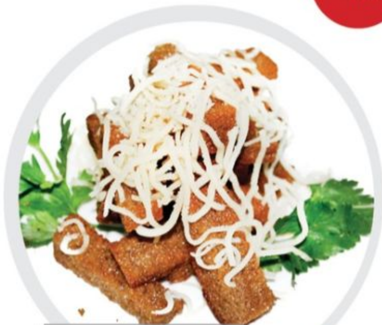
ГРЕНКИ ХЛЕБНЫЕ С ЧЕСНОКОМ И СЫРОМ