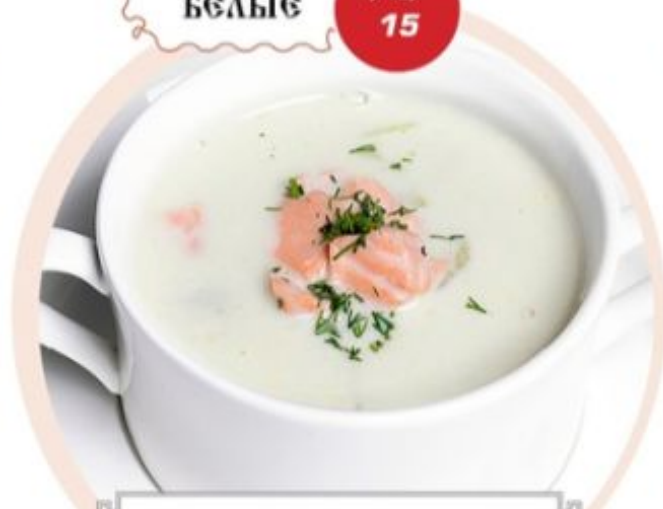
СЛИВОЧНО-СЫРНЫЙ СУПЧИК С ФИЛЕ ЛОСОСЯ