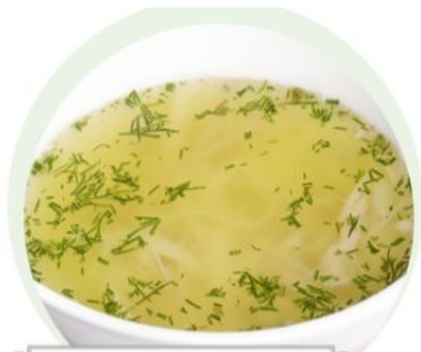
КУРИНЫЙ БУЛЬОН С ЛАПШОЙ И ЗЕЛЕНЬЮ