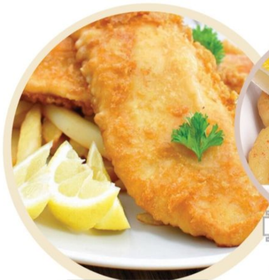
СУДАК В КЛЯРЕ С СОУСОМ "ТАР-ТАР"