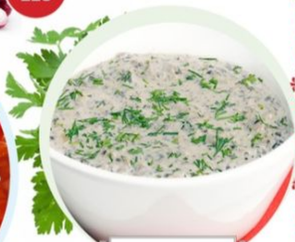
КРЕМ-СУП ИЗ ГРИБОВ